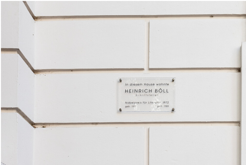
Tafel am Heinrich-Böll-Haus im Kölner Agnesviertel (2021)