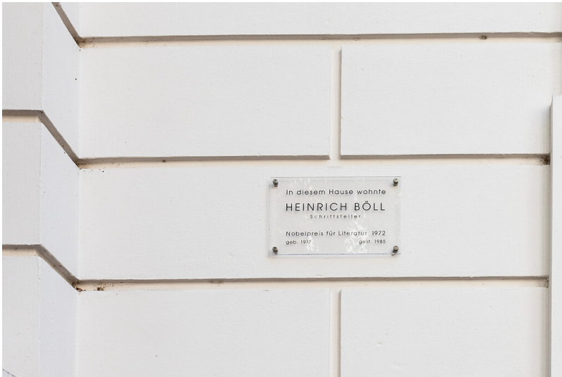
Tafel am Heinrich-Böll-Haus im Kölner Agnesviertel (2021)