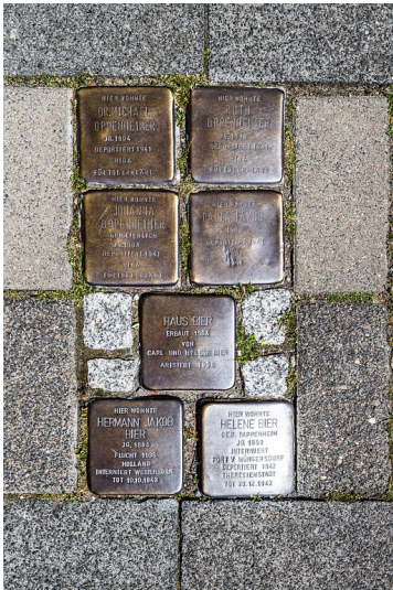
Stolpersteine vor dem "Haus Bier" im Kölner Agnesviertel (2021)