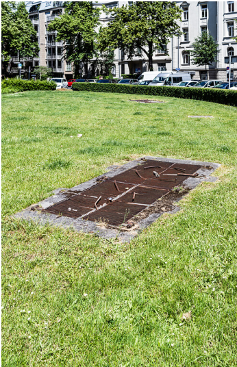
Eingang zum Luftschutzbunker vor dem Oberlandesgericht Köln im Agnesviertel (2021)