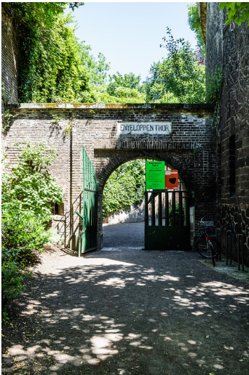
Eingangstor zum Rosengarten des Forts X im Kölner Agnesviertel (2021)