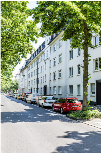
Häuserzeile am Neusser Wall in Köln (2021)