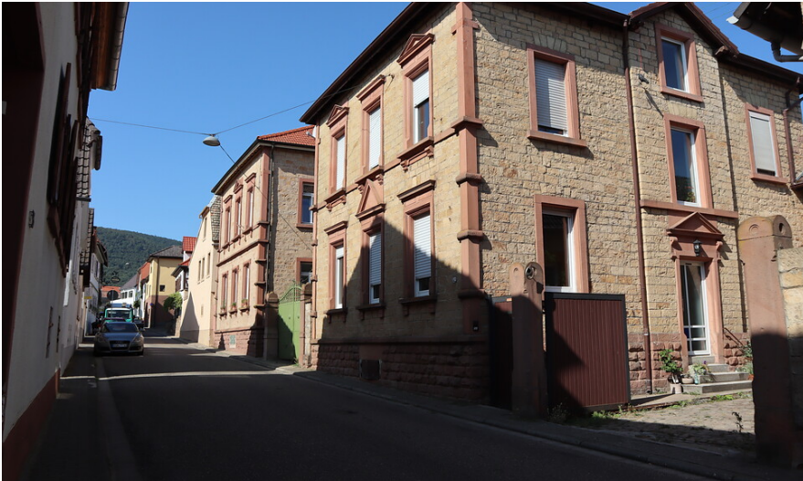
Wohnhaus Hauptstraße 42 in Alsterweiler (2020)