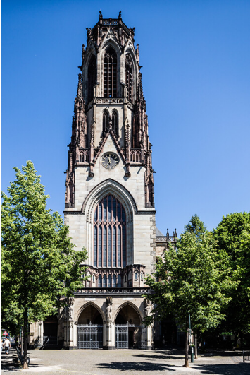
St. Agnes mit Neusser Platz im Kölner Agnesviertel (2021)