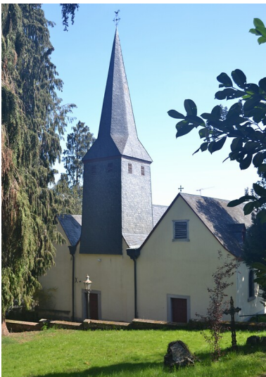
Kapelle Alt-St. Nikolaus von Südwesten aus betrachtet (2021).