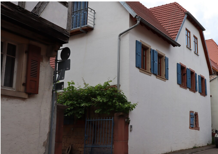
Hakenhof Hauptstraße 41 in Alsterweiler (2020)