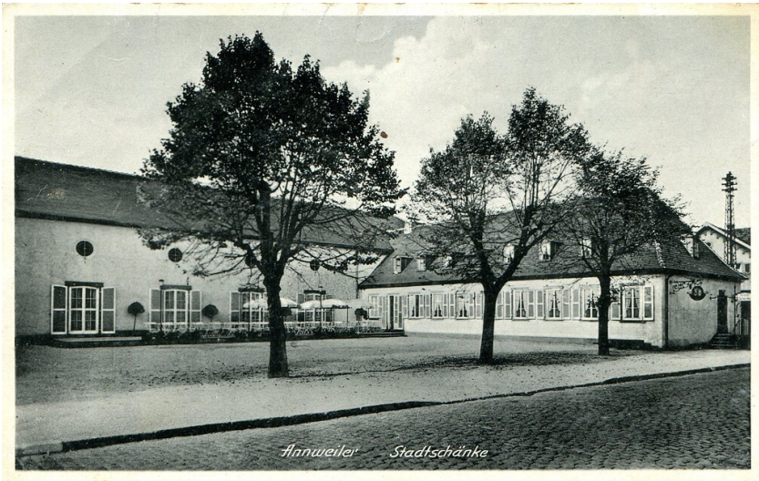
Historische Postkarte der Stadtschänke im Gebäude des Hohenstaufensaals in Annweiler am Trifels (1950er Jahre)