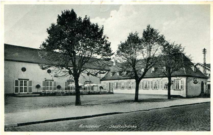
Historische Postkarte der Stadtschänke im Gebäude des Hohenstaufensaals in Annweiler am Trifels (1950er Jahre)