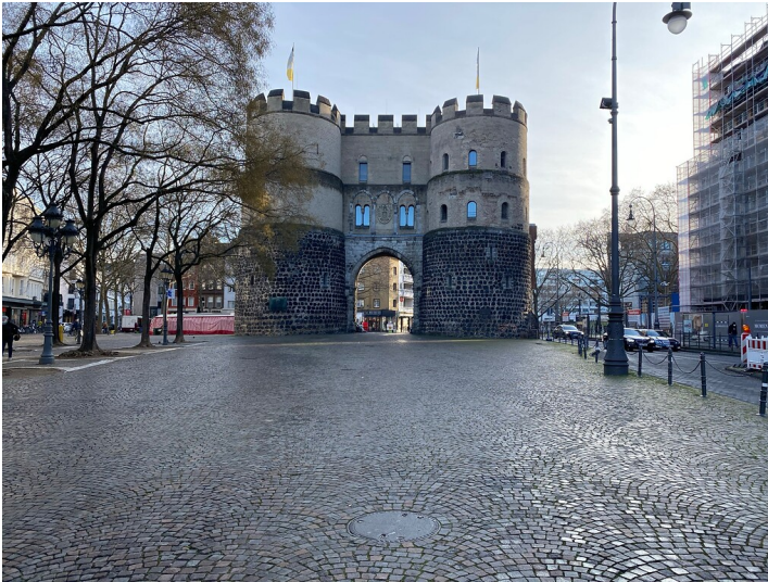
Rudolfplatz mit Hahnentor in Köln (2021)