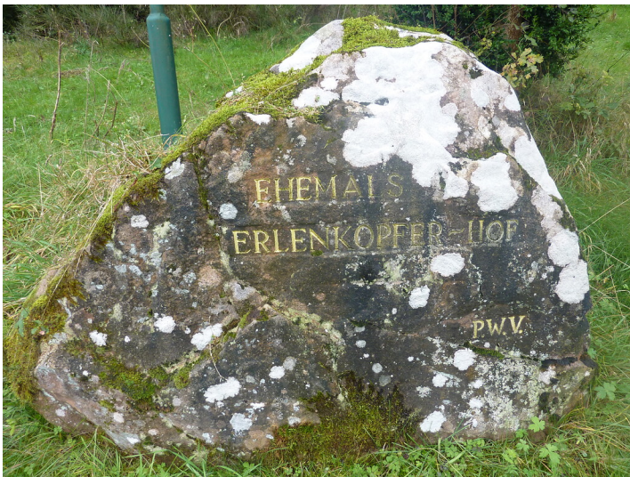
Ritterstein Nr. 195 Ehemals Erlenkopfer-Hof südöstlich von Eppenbrunn am Erlenkopf (Eitelmann, S. 148).