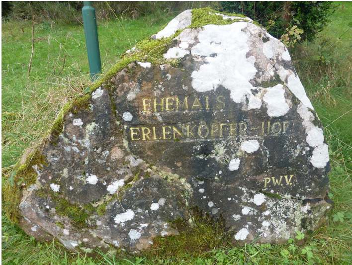
Ritterstein Nr. 195 Ehemals Erlenkopfer-Hof südöstlich von Eppenbrunn am Erlenkopf (2013)