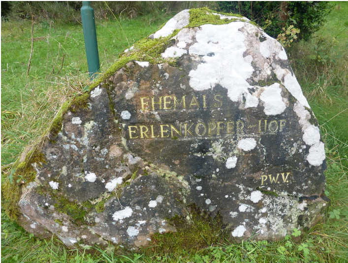
Ritterstein Nr. 195 Ehemals Erlenkopfer-Hof südöstlich von Eppenbrunn am Erlenkopf (Eitelmann, S. 148).