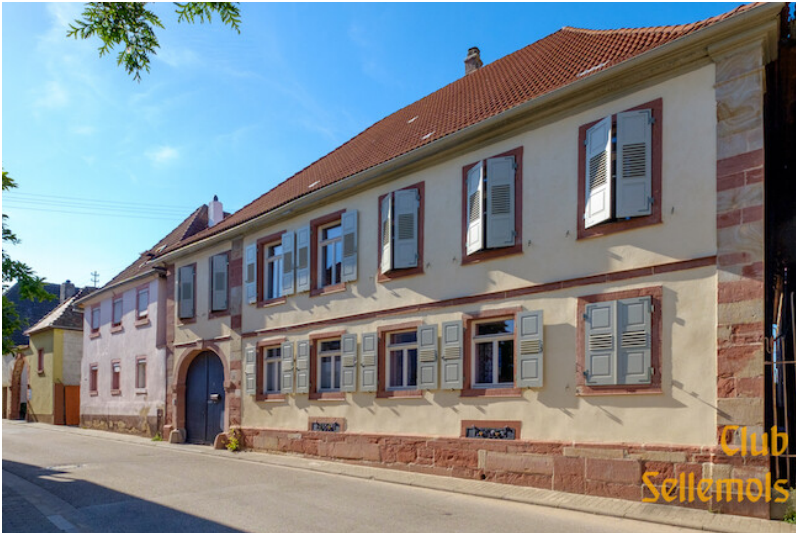
Wohnhaus (Barock) Hauptstraße 8 Alsterweiler (2020)