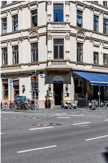
Brauhaus Stüsser im Kölner Agnesviertel (2021)