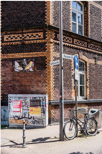
Ecke Balthasar-/Kasparstraße im Kölner Agnesviertel (2021)