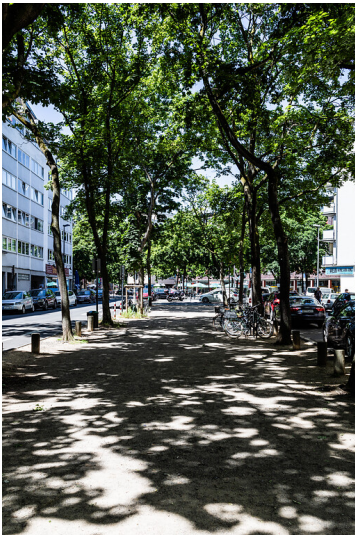
Blick auf die Kölner Sudermannstraße vom Ebertplatz aus (2021)