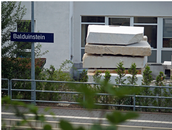
Bahnsteig am Bahnhof Balduinstein mit dem Firmengelände der THUST STEIN GmbH (2020)