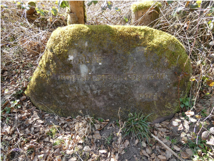
Ritterstein Nr. 192 Ruine Roesselsbrunner Hof südwestlich von Ludwigswinkel (2022)