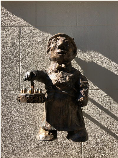
Köbes-Figur mit Kölschkranz am Peters Brauhaus in der Kölner Altstadt (2021)