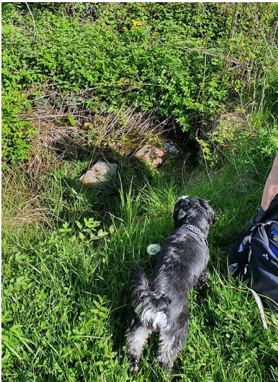
Quelle des Elzbachs bei Bereborn im Landkreis Vulkaneifel (2021).