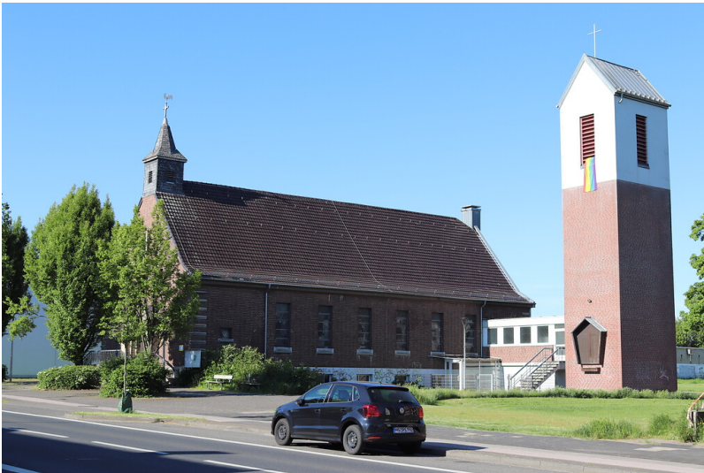
Katholische Kirche Sankt Fidelis in Boscheln (2021)