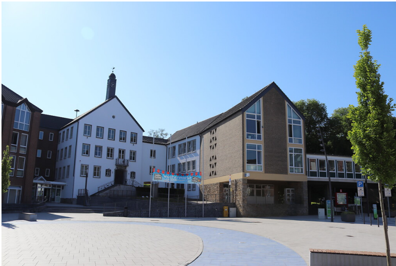
Erstes Rathaus von Übach-Palenberg (2021)