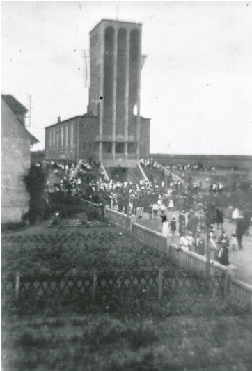
Einweihung der Evangelischen Erlöserkirche in Palenberg (1932)