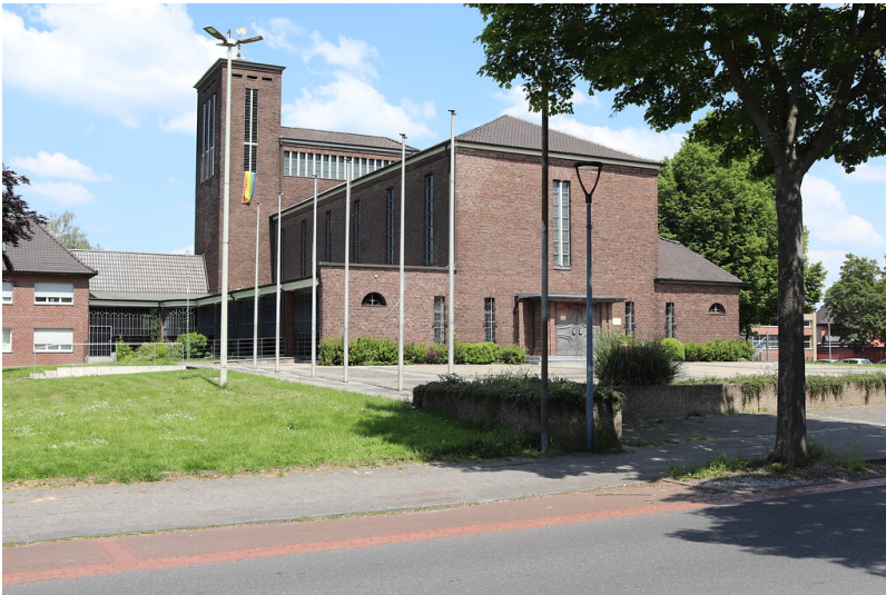
Katholische Kirche Sankt Theresia in Palenberg (2021)