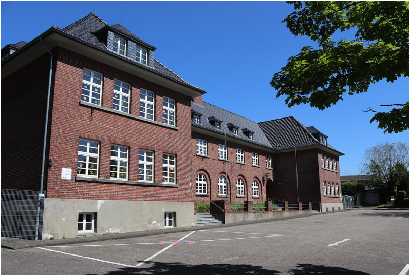
Katholische Volksschule Übach (2021)