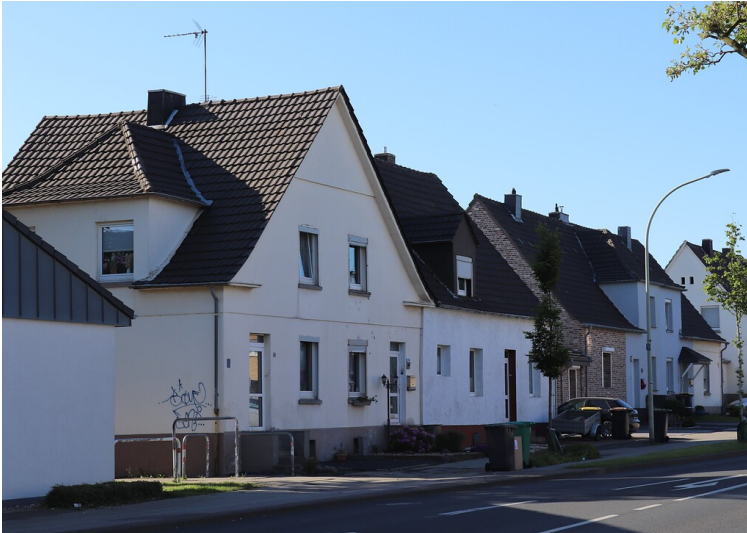
Werkssiedlung Boscheln der Aachener Bergmannssiedlungsgesellschaft (2021)