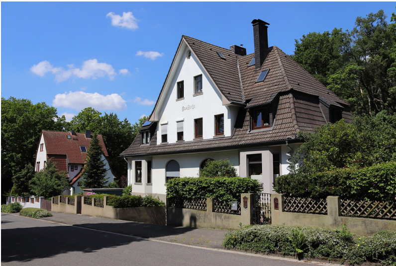
Wohnhäuser der gehobenen Angestellten der Grube Carolus Magnus in Palenberg (2021)