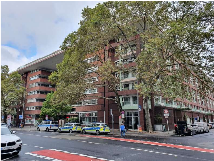
Am ehemaligen Standort der Alten Kölner Hauptpost wurde eine Seniorenresidenz errichtet (2021)