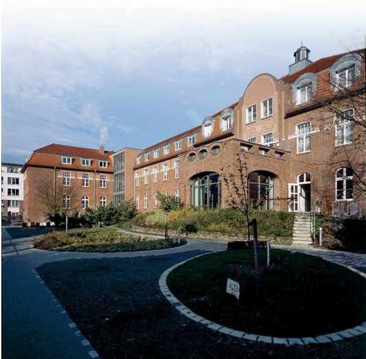
Der restaurierte historische Flügel des ehemaligen israelitischen Asyls in Köln-Neuehrenfeld (2009). Heute befindet sich hier das Wohlfahrtszentrum der jüdischen Gemeinde.