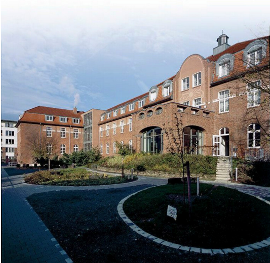
Der restaurierte historische Flügel des ehemaligen israelitischen Asyls in Köln-Neuehrenfeld (2009). Heute befindet sich hier das Wohlfahrtszentrum der jüdischen Gemeinde.