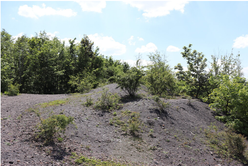
Auf der Bergehalde der Gewerkschaft Carolus Magnus (2021)