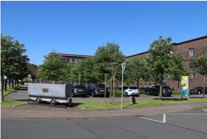
Letzte Lore der Grube Carolus Magnus in Palenberg (2021)