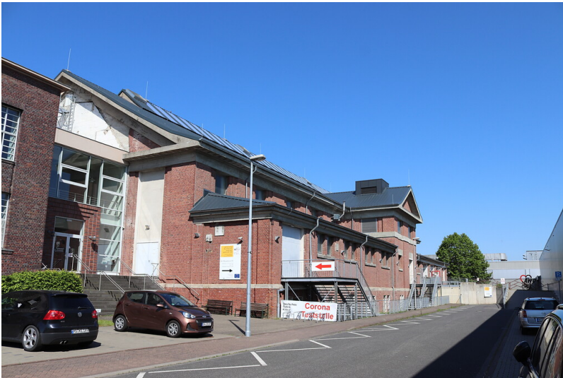
Waschkaue der Grube Carolus Magnus in Palenberg, heute Veranstaltungshalle sowie Weiterbildungs- und Qualifizierungszentrum (2021)