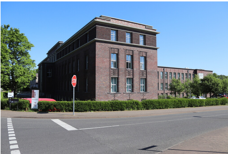
Verwaltungs- und Betriebsgebäude der Gewerkschaft Carolus Magnus in Palenberg (2021)