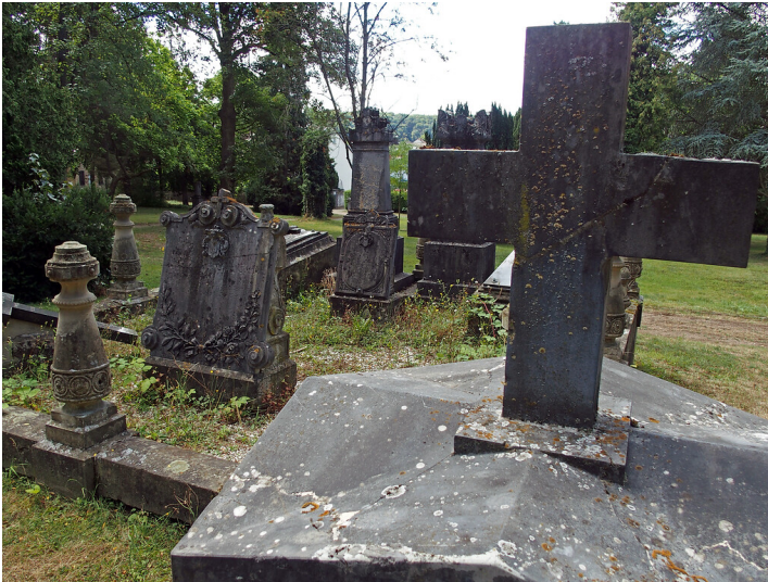
Grabsteine im Robert-Heck-Park in Diez (2020)