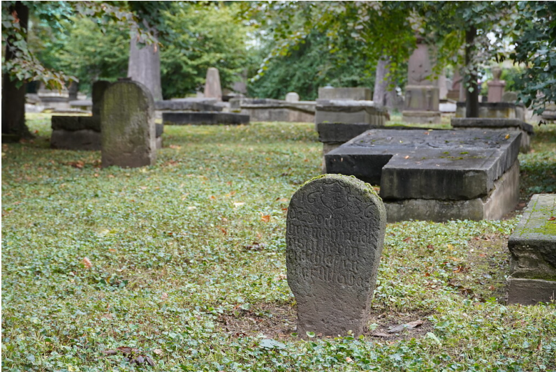
Grabsteine auf dem historischen Geusenfriedhof in Köln-Lindenthal (2021).