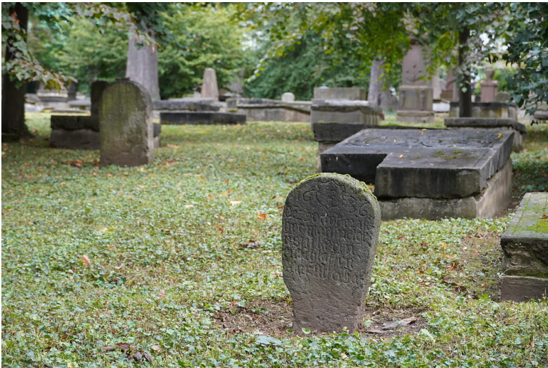
Grabsteine auf dem historischen Geusenfriedhof in Köln-Lindenthal (2021).