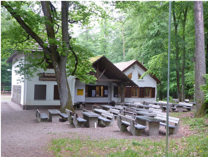
Außenaufnahme der Totenkopfhütte bei Maikammer