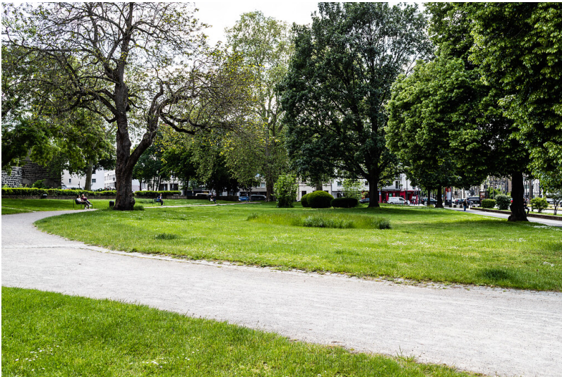
Grünanlage des Hansaplatzes in der Kölner Altstadt-Nord (2021)