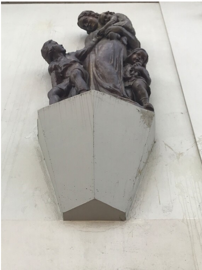
Plastik "Mutter mit Kindern" an der Ostfassade der ehemaligen Marienschule in Frechen (2021) Fotograf/Urheber: Nicole Schmitz