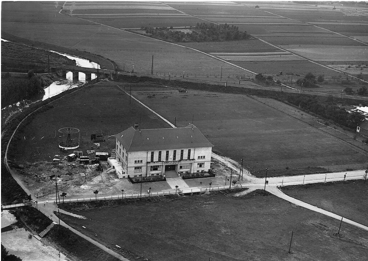
Volkshaus in Bad Vilbel (1928)