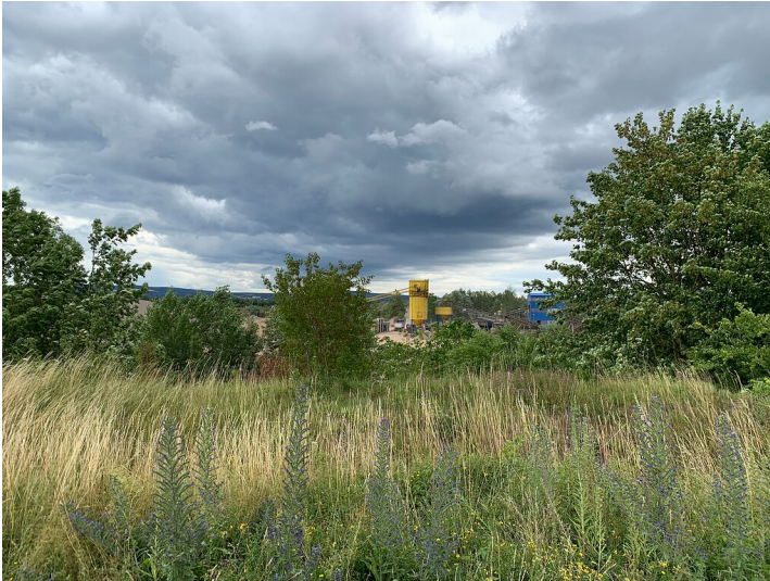
Blick von der Kiesgrube in Urmitz Bahnhof zum nahegelegenen Kieswerk (2020)