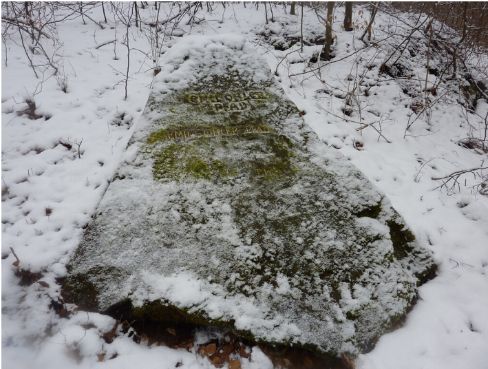
Ritterstein Nr. 189 Emil-Ohler-Pfad südöstlich von Breitenstein (2013)