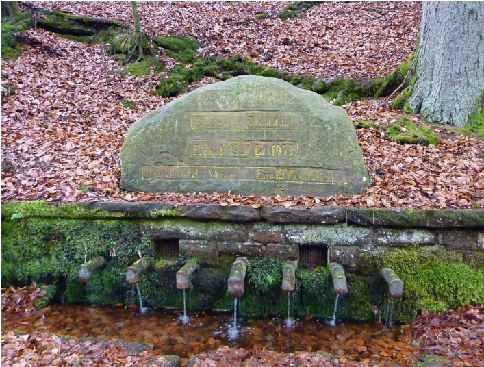
Ritterstein Nr. 188 Siebenbrunnen Erbaut 1927 nordöstlich von Fischbach (2013)