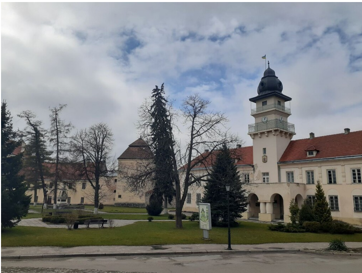
New Town Hall in Zhovkva (2021)