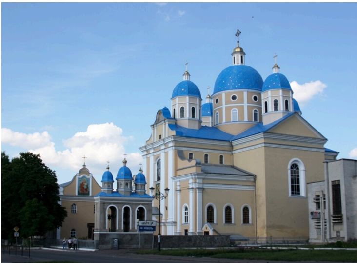
Church of the Holy Spirit in Chervonohrad (2008)