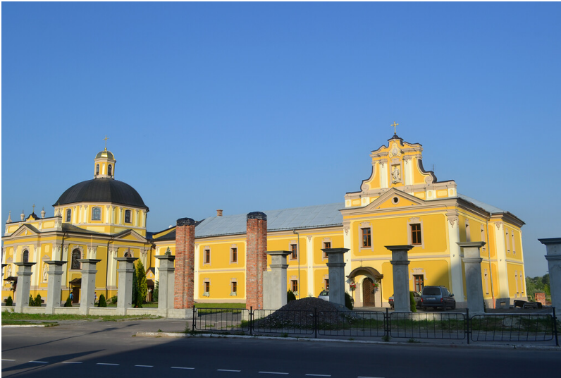
Basilian Church and monastery &#1089;omplex in Chervonohrad (2014)