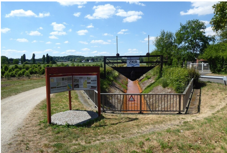
Ankerpunkt Aachener Straße des Lehr- und Erlebnispfads Energie & Wasser am Kölner Randkanal (2020)