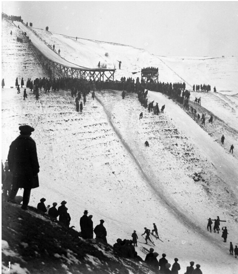
Ski jumping hill in Kaiserwald (Lviv; 1930-1939)