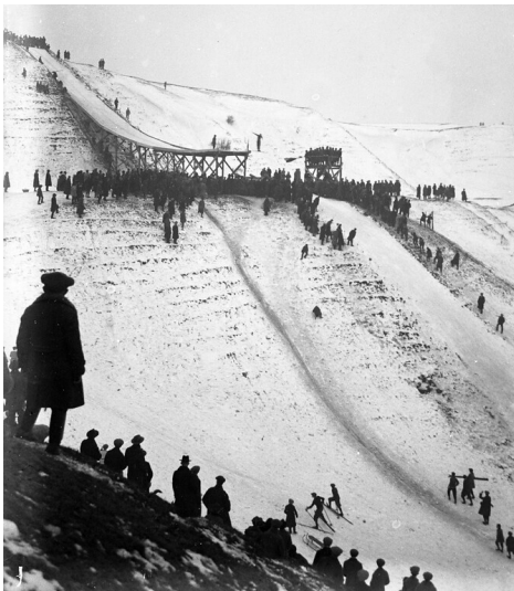
Ski jumping hill in Kaiserwald (Lviv; 1930-1939)