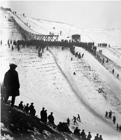
Ski jumping hill in Kaiserwald (Lviv; 1930-1939)